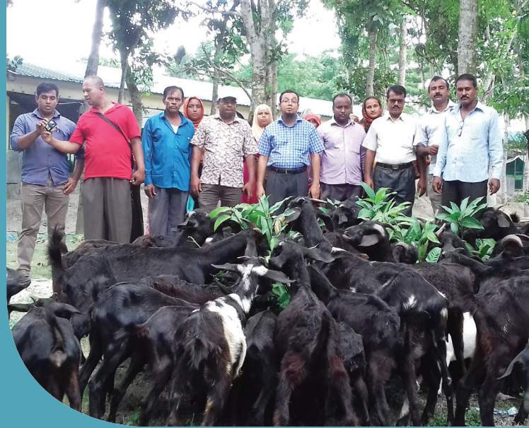
যশোরের চৌগাছা উপজেলায় ছাগল পালন প্রশিক্ষণ