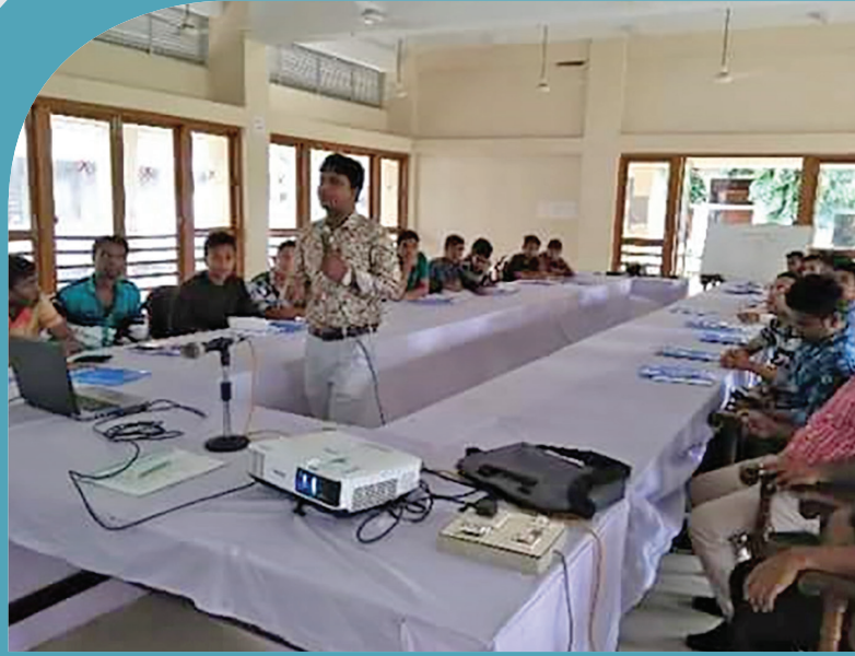
চট্টগ্রামের মীরসরাই উপজেলায় মোবাইল সার্ভিসিং প্রশিক্ষণ