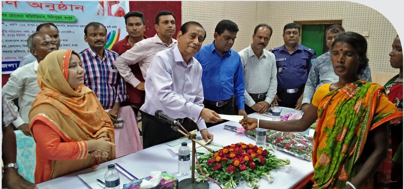
একটি বাড়ি বাড়ি একটি খামার (৩য় সংশোধিত) প্রকল্পের আওতায় সমবায় অধিদপ্তর কর্তৃক বাস্তবায়নাধীন “সমবায়ের মাধ্যমে ক্ষুদ্র নৃ-তাত্ত্বিক জনগোষ্ঠীর জীবনযাত্রার উন্নয়ন” কম্পোনেন্ট এর আওতায় রংপুর জেলার মিঠাপুকুর উপজেলায় জনপ্রশাসন মন্ত্রণালয় সম্পর্কিত সংসদীয় স্থায়ী কমিটির সভাপতি জনাব এইচ এন আশিকুর রহমান, এমপি উপকারভোগীদের মাঝে বিশেষ উৎসাহ ঋণের চেক বিতরণ করেন।