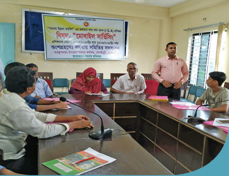
নোয়াখালীর সোনাইয়ুড়ী উপজেলায় মোবাইল সার্ভিসিং প্রশিক্ষণ