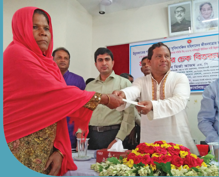
জামালপুরের মাদারগঞ্জ উপজেলায় উন্নত জাতের গাভী পালনের মাধ্যমে সুবিধাবঞ্চিত মহিলাদের জীবনযাত্রার মান উন্নয়ন শীর্ষক প্রকল্পের সুবিধাভোগী সদস্যদের মাঝে ঋণের চেক বিতরণ করেন বস্ত্র ও পাট মন্ত্রণালয়ের প্রতিমন্ত্রী জনাব মির্জা আজম এমপি।