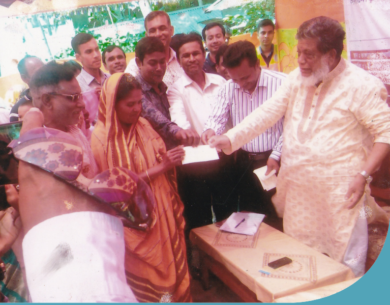
গাইবান্ধার সাঘাটা উপজেলায় উন্নত জাতের গাভী পালনের মাধ্যমে সুবিধাবঞ্চিত মহিলাদের জীবনযাত্রার মান উন্নয়ন শীর্ষক প্রকল্পের সুবিধাভোগী সদস্যদের মাঝে ঋণের চেক বিতরণ করেন জাতীয় সংসদের ডেপুটি স্পিকার জনাব মোঃ ফজলে রাব্বি মিয়া এমপি।