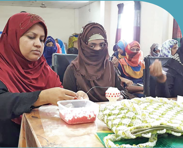
কুমিল্লায় ক্রিস্টাল শো-পিস তৈরি বিষয়ক প্রশিক্ষণ